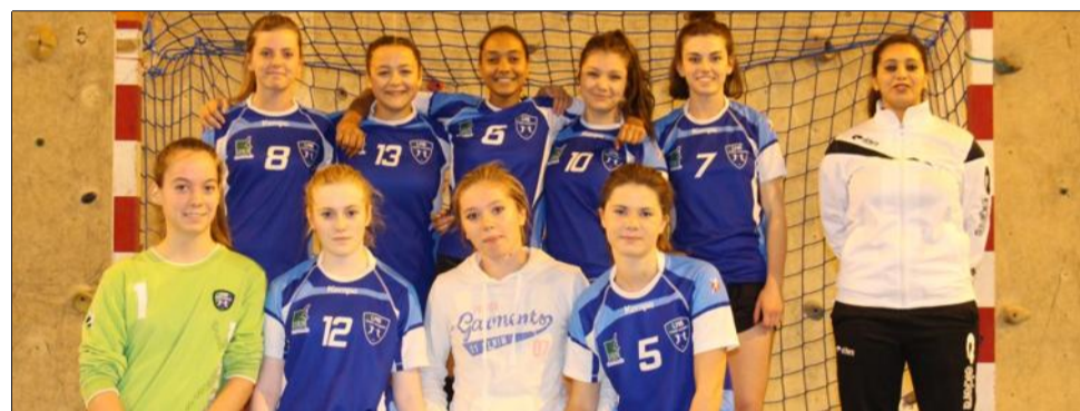
L'exploit du week-end revient aux -18 ans filles.

Les jeunes de l'entente Lorioi-Livron ont vu leurs deux équipes de -18 ans l'emporter tant chez les garçons que chez les filles.