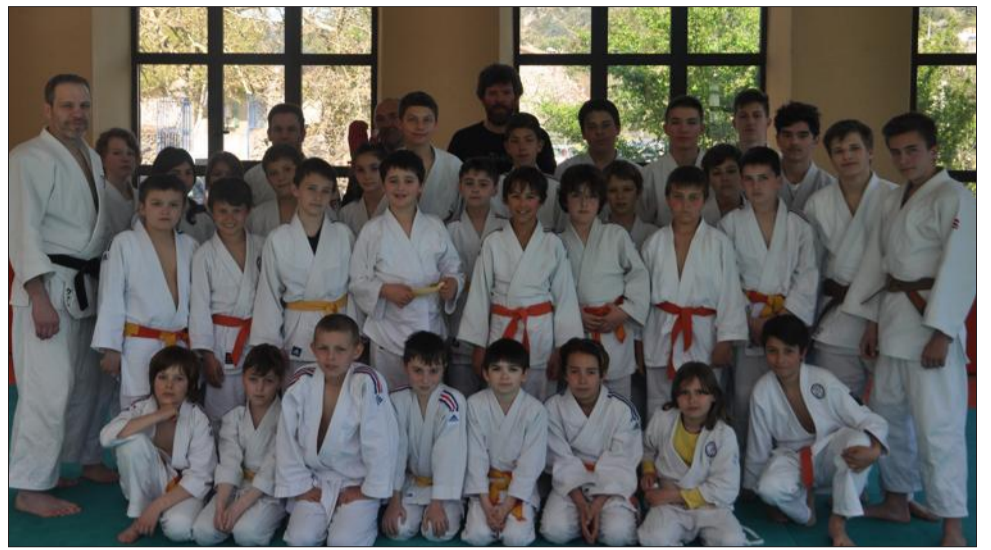
Les 35 jeunes judokas, âgés de 10 à 16 ans sont rentrés fatigués mais heureux après trois jours de judo et d'animations extra-sportives.

Le week-end s'est clôturé avec un match de thèque, jeu sportif similaire au baseball, avant de reprendre le chemin du retour.