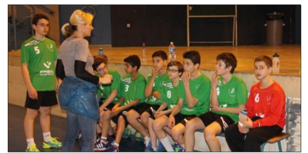
Les -14 ans garçons à l'écoute des dernières consignes de jeu.

En senior, les deux équipes féminines n'ont pas réussi à accrocher une victoire avant les vacances du printemps. L'équipe 2 s'est inclinée face à Saint-Valier 19-13 pour son dernier match de championnat, une défaite logique où les Lorioisaises ont montré un bel esprit collectif. A Annonay, l'équipe 1 filles s'est inclinée 25-20. L'équipe 3